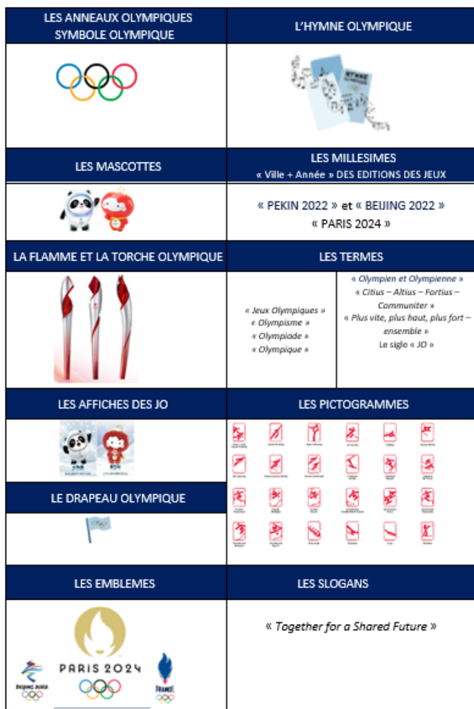
Annexe : Exemples propriétés olympiques

Vous bénéficiez concernant vos données, du droit d'être informé de la collecte et du traitement, du droit d'accès, du droit de rectification ou d'effacement, de modification de vos données en cas d'informations incorrectes, du droit d'opposition, du droit à limitation du traitement ainsi que du droit à la récupération de vos données. Ces droits peuvent être exercés directement par courrier adressé au CNOSF – 1, avenue Pierre de Coubertin – 75640 PARIS Cedex 13 ou par courriel à dpo@cnosf.org .